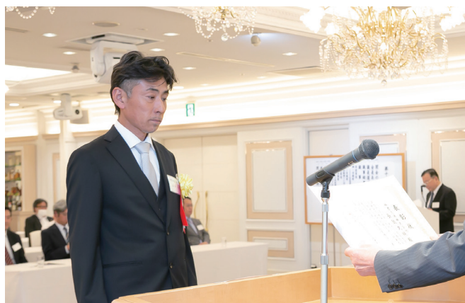
保安業務永年従事者表彰