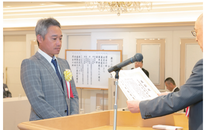
優良運送指導員表彰