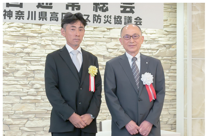
保安業務永年従事者